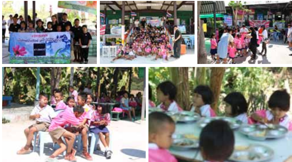
มอบทุนการศึกษา และจัดจิตอาสา ร่วมจัดกิจกรรมสันทนาการ และเลี้ยงอาหารกลางวันเด็กนักเรียน โรงเรียนบ้านหนองตอตะเคียน จ.สระบุรี

1.2 มูลนิธิ ซี.ซี.เอฟ. เพื่อเด็กและเยาวชน ในพระราชูปถัมภ์สมเด็จพระเทพรัตนราชสุดาฯ สยามบรมราชกุมารี บริษัทฯ สนับสนุนการดำเนินงานของ มูลนิธิ ซี.ซี.เอฟ. อย่างต่อเนื่อง เพื่อสนับสนุนภารกิจในการพัฒนาเด็กและเยาวชนให้มีคุณภาพชีวิตที่ดี ทั้งด้านการศึกษาและสุขภาพอนามัย ให้เด็กด้อยโอกาสในทุกภูมิภาคของประเทศ ได้มีสุขภาพแข็งแรง ได้รับการศึกษา และพัฒนาภาวะผู้นำ ตลอดจนมีชีวิตความเป็นอยู่ที่ดีขึ้นจากการให้ความรู้ทางด้านการประกอบอาชีพตามหลักเศรษฐกิจพอเพียง โดยในปี 2560 นี้ บริษัทฯ ร่วมสนับสนุนน้ำดื่มในกิจกรรมวันครอบครัว ซี.ซี.เอฟ. สืบสานปณิธานพ่อหลวง ซึ่งเป็นการจัดให้เด็กและผู้ปกครองได้พบกัน และมีกิจกรรมร่วมแสดงความอาลัยแด่พระบาทสมเด็จพระปรมินทรมหาภูมิพลอดุลยเดช