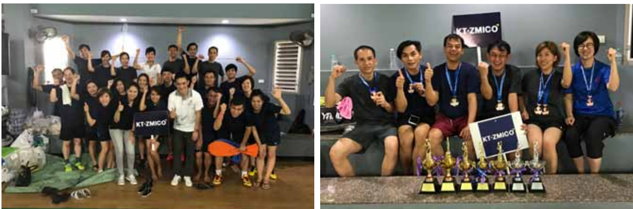
Broker Badminton Championship 2017