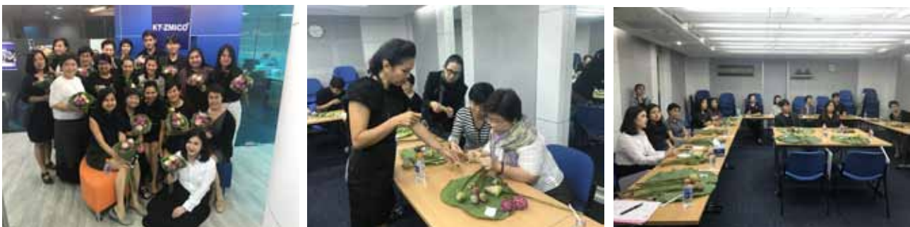
กิจกรรมพับกลีบบัวเจริญสติ

บริษัทฯ มีนโยบายการเสริมสร้างสุขภาวะที่ดีในองค์กร ทั้งทางด้านสุขภาพกายและสุขภาพใจ ให้พนักงานมีความสุขในการทำงาน และการดำรงชีวิต จึงจัดให้มีโครงการ Health & Wellbeing โดยในปี 2560 ได้จัดกิจกรรมพับกลีบบัวเจริญสติ ฝึกการพับกลีบบัวในแบบต่างๆ ควบคู่ไปกับการฝึกสติ ซึ่งสามารถนำมาปรับใช้กับการทำงานและการดำเนินชีวิตในด้านต่างๆ ได้อย่างมีสติและมีความสุข