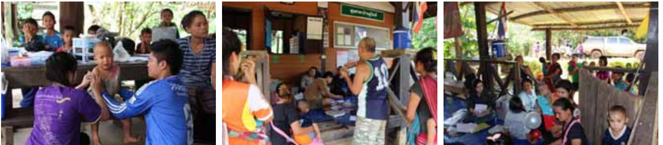
บ้านยูไนท์ เป็นหมู่บ้านกะเหรี่ยงกลางป่าทุ่งใหญ่นเรศวร ชาวบ้านมีฐานะยากจน