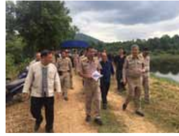
คณะผู้บริหารและภาคี เข้าเยี่ยมชมการดำเนินการขุดท่อ