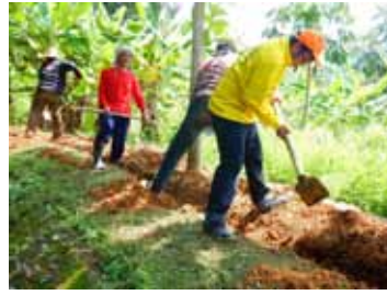
การขุดดินเพื่อวางท่อส่งน้ำ