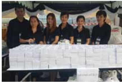
กิจกรรมจิตอาสาแจกอาหารและเครื่องดื่ม วันที่ 26 ตุลาคม 2560