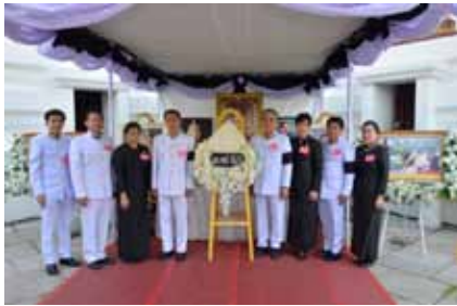
บริษัทฯ ร่วมเป็นเจ้าภาพบำเพ็ญพระราชกุศล สวดพระอภิธรรมพระบรมศพ พระบาทสมเด็จพระปรมินทรมหาภูมิพลอดุลยเดช