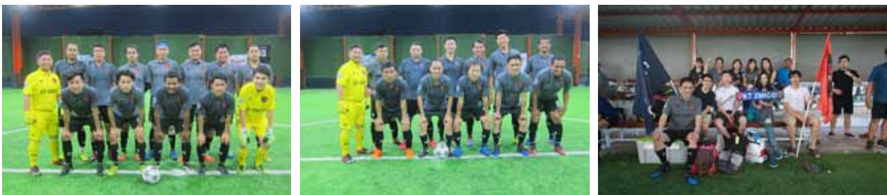
Singha Broker Cup 2017

บริษัทฯ สนับสนุนให้บุคลากรเล่นกีฬา ส่งเสริมนักกีฬาที่มีความสามารถให้เป็นตัวแทนบริษัทฯ ไปร่วมแข่งขันกีฬาระหว่างกลุ่มธุรกิจหลักทรัพย์ การแข่งขันกีฬาที่จัดเป็นประจำทุกปี ได้แก่ การแข่งขันฟุตบอล Singha Broker Cup การแข่งขันแบดมินตัน Broker Badminton Championship และการแข่งขันปิงปอง SET-Broker Table Tennis Championship ซึ่งการแข่งขันกีฬาต่างๆ ดังกล่าว เป็นการจัดขึ้นเพื่อกระชับความสัมพันธ์ระหว่างหน่วยงานในกลุ่มธุรกิจหลักทรัพย์และหน่วยงานที่เกี่ยวข้อง โดยใช้กีฬาเป็นสื่อกลาง ได้แก่ บริษัทสมาชิกในกลุ่มบริษัทหลักทรัพย์ สมาคมบริษัทหลักทรัพย์ไทย บริษัทสมาชิกชมรมผู้ประกอบการธุรกิจสัญญาซื้อขายล่วงหน้า ตลาดหลักทรัพย์แห่งประเทศไทย ตลาดสินค้าเกษตรล่วงหน้าแห่งประเทศไทย สมาคมบริษัทจดทะเบียนไทย สมาคมตราสารหนี้ไทย ชมรมนักข่าว และกองทุนบำเหน็จบำนาญข้าราชการ เป็นต้น การแข่งขันกีฬาถือเป็นกิจกรรมที่ส่งเสริมสุขภาพ และสร้างความสามัคคีระหว่างพนักงาน รวมถึงความสัมพันธ์ที่ดีระหว่างหน่วยงานด้วย