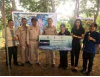
มอบเงินสนับสนุนโครงการ