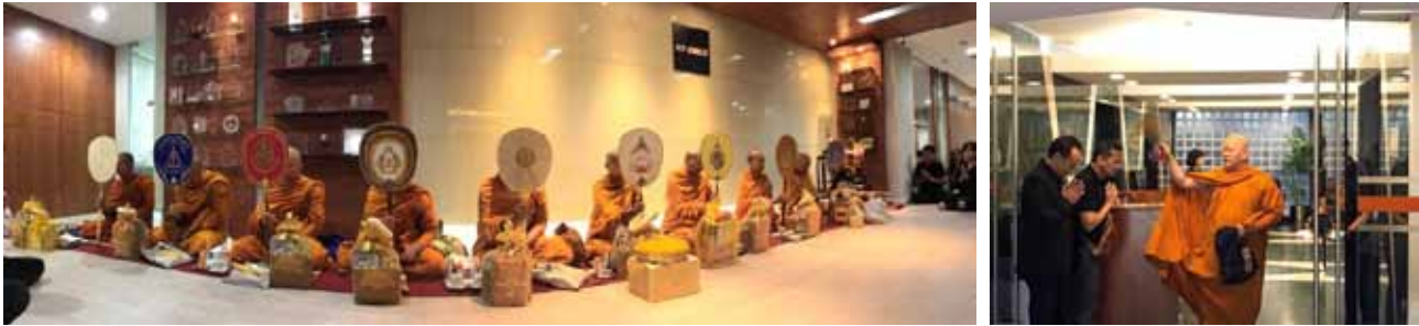
พิธีทำบุญบริษัทประจำปี 2560

นอกจากการพัฒนาบุคลากรทางความรู้ ทักษะความสามารถในการประกอบวิชาชีพเพื่อให้เกิดผลการปฏิบัติงานที่เป็นเลิศ แล้วนั้น บริษัทฯ ยังให้ความสำคัญกับการพัฒนาคุณภาพชีวิตของบุคลากรด้านอารมณ์และจิตใจอีกด้วย ในปี 2560 บริษัทฯ จัดพิธีทำบุญบริษัทประจำปี โดยนิมนต์พระสงฆ์ จากวัดชนะสงครามราชวรมหาวิหาร จำนวน 9 รูป ประกอบพิธีเจริญพระพุทธมนต์เย็น และบรรยายธรรม และบริษัทได้ร่วมเป็นเจ้าของภาพในงานทอดกฐินพระราชทาน งานทอดผ้าป่าสามัคคี กับหน่วยงานต่างๆ อาทิเช่น ธนาคารกรุงไทย สำนักงานป้องกันและปราบปรามการฟอกเงิน และสำนักงานประกันสังคม เป็นต้น