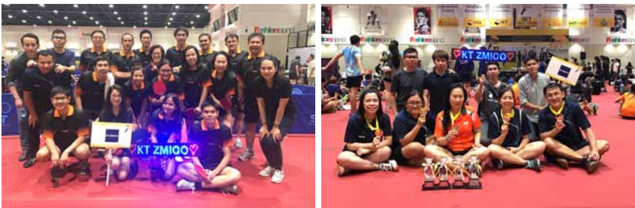
7 SET-Broker Table Tennis Championship 2017