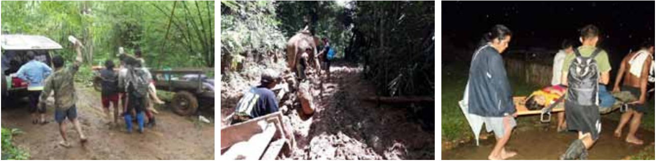
ความทุรกันดารและระยะทางที่ห่างไกล เป็นอุปสรรคในการเข้าถึงการรักษาพยาบาลของประชาชน