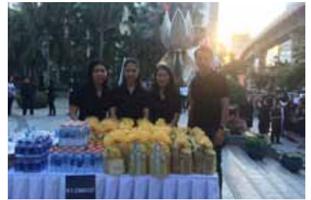
ทำบุญตักบาตรข้าวสารอาหารแห้ง ร่วมกับธนาคารกรุงไทย