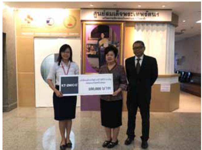
มอบเงินให้ศูนย์สมเด็จพระเทพรัตนฯ เพื่อช่วยเหลือค่าใช้จ่ายครอบครัวผู้ป่วยที่มีฐานะยากจน และมอบตุ๊กตาเพื่อเป็นกำลังใจให้กับเด็กที่มาเข้ารับการรักษา