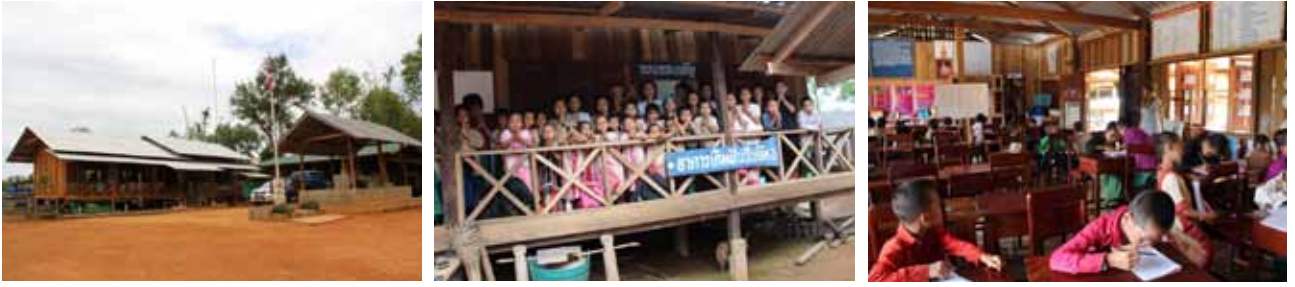
อาคารเรียนปัจจุบัน ศศช. บ้านมอตะหลั่ว อำเภอยูมผาง จังหวัดตาก