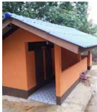
สภาพหลังซ่อมแซมห้องสุขา และปรับปรุงภูมิทัศน์โดยรอบให้สะอาดปลอดภัย