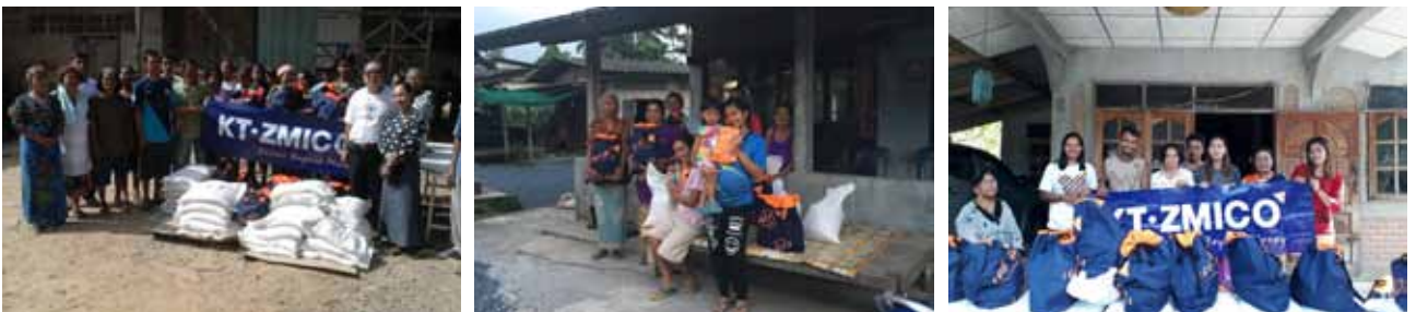
มอบถุงยังชีพให้ผู้ประสบอุทกภัย ในพื้นที่อำเภอชะอวด อำเภอทุ่งสง อำเภอเชียรใหญ่ จังหวัดนครศรีธรรมราช ในเดือนมกราคม 2560

ในปี 2560 เกิดเหตุอุทกภัยในพื้นที่จังหวัดภาคใต้หลายจังหวัด มีประชาชนที่ได้รับความเดือดร้อนเป็นจำนวนมาก บริษัทฯ ได้มอบเงินบริจาคให้กับมูลนิธิอาสาเพื่อนพึ่ง (ภาฯ) ยามยาก สภากาชาดไทย เพื่อให้มูลนิธิฯ นำไปจัดทำถุงยังชีพมอบแก่ผู้ประสบอุทกภัย และเพื่อช่วยเหลือในด้านต่างๆ นอกจากนี้ บริษัทฯ ได้มอบถุงยังชีพเพื่อช่วยเหลือประชาชนผู้เดือดร้อนจากเหตุอุทกภัย ในพื้นที่อำเภอชะอวด อำเภอทุ่งสง อำเภอเชียรใหญ่ จังหวัดนครศรีธรรมราช